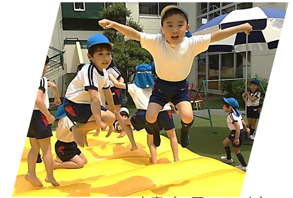
中庭 (エアーマット)

子どもに『意欲』を持たせる方法、それは私たちが勇気を持って、子どもが真剣に挑み向かう体験機会を与えることです。自身の中から湧き出す意思に裏打ちされた本物の『意欲』により、その子自身のかけがえのない生きる力が生まれます。